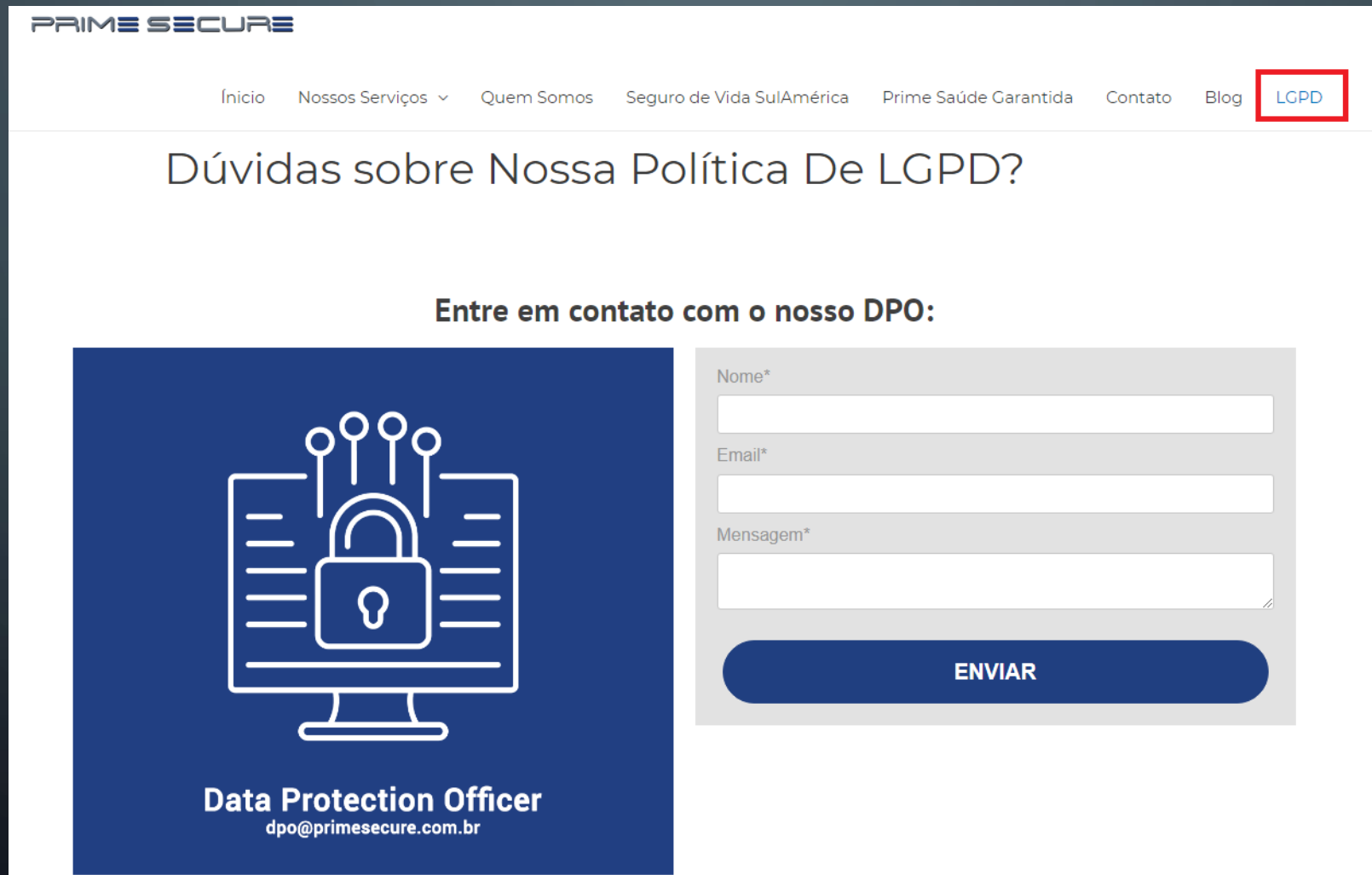
IMAGEM DO SITE – MENU LGPD